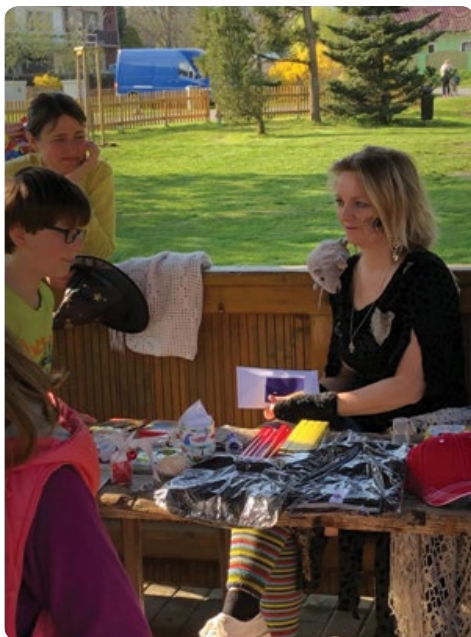
Za malé fotbalisty, Naši Jezerníci, maminky a ostatní čarodějnice zapsal Laďa Pacák