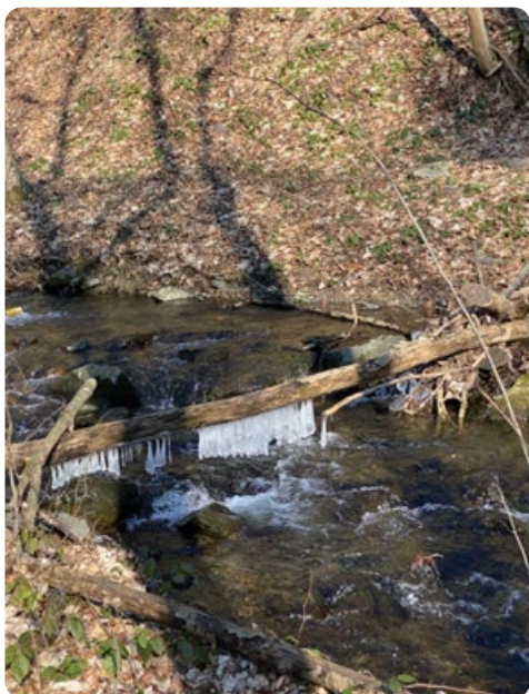
Jezerský potok v Pekle