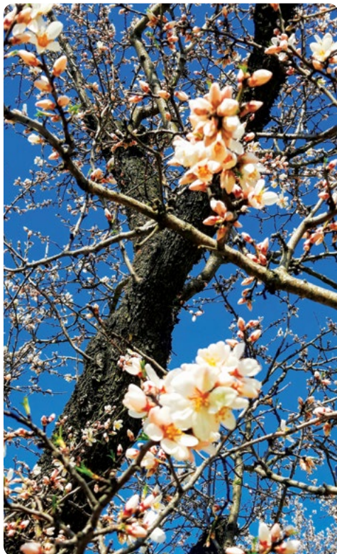
Z mandloňových sadů, Hustopeče u Brna

Vážení a milí Jezeráci, příznivci obce, konečně jsme se vyloupli z většiny covidových omezení a život se může vracet do normálního stavu. Ve čtvrtek 10. června od 15 hodin Vás srdečně zveme na slavnostní otevření nové obnovené zahrady mateřské školy. V sobotu 19. června od 15 hodin připravují rodiče pro své děti Kouzelný les ve sportovním areálu a v okolí. V srpnu, po dvouleté přestávce, pozve obec seniory na jejich tradiční setkání v kulturním domě a v září přivítáme nové občanky Jezernice, některé už mírně odrostlé. Poslední vítání se uskutečnilo 6. října 2019 a setkání seniorů v dubnu 2019. Trochu spěcháme, akce plánujeme na léto, aby nás opět nezastavila případná podzimní vlna epidemie. Věříme, že ke společenskému životu přispěje i pronájem hospůdky na hřišti novému nájemci, Ing. Hanzlíčkovi z Hranic. Zahájení provozu se plánuje na sobotu 12. června. Děkujeme za dobrou a dlouhodobou spolupráci sokolům, kteří zajišťovali provoz hospůdky od r. 2013, kdy obec koupila hřiště od Agrochovu, a.s.