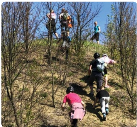
Výstup na rozhled do lomu