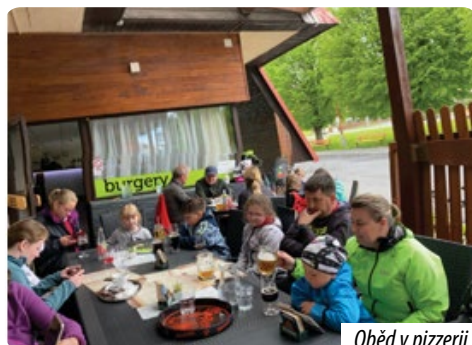
Oběd v pizzerii