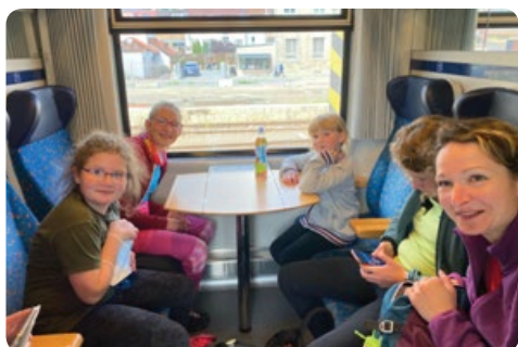
Osazenstvo dámského oddílu