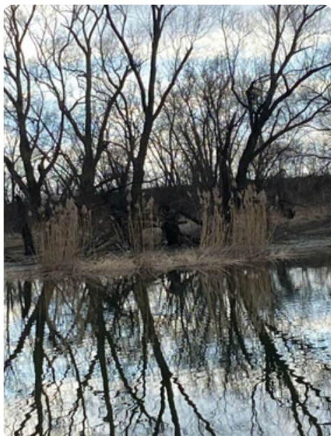
Poblíž Oseckého jezu