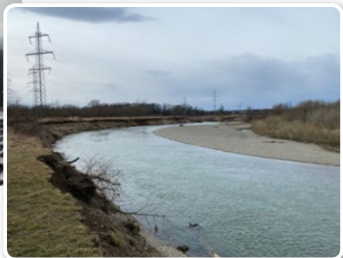
Bečva u Prosenic ▶