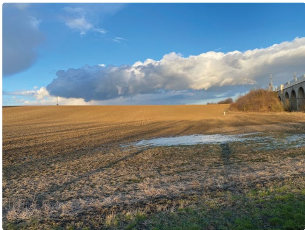
Předjaří u mostů