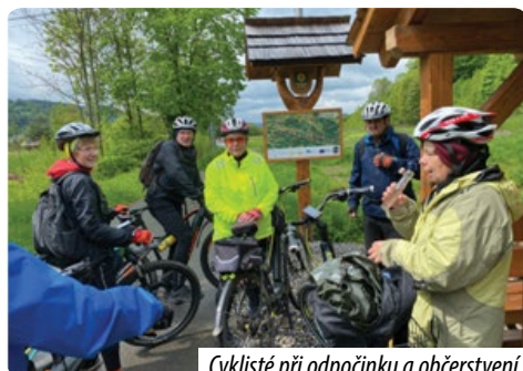
Cyklisté při odpočinku a občerstvení