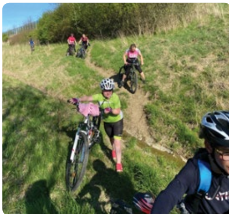
Krosová vložka podél dálnice