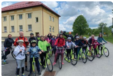
Foto u ZŠ Hovězí