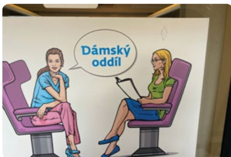
Dámský oddíl ve vlaku