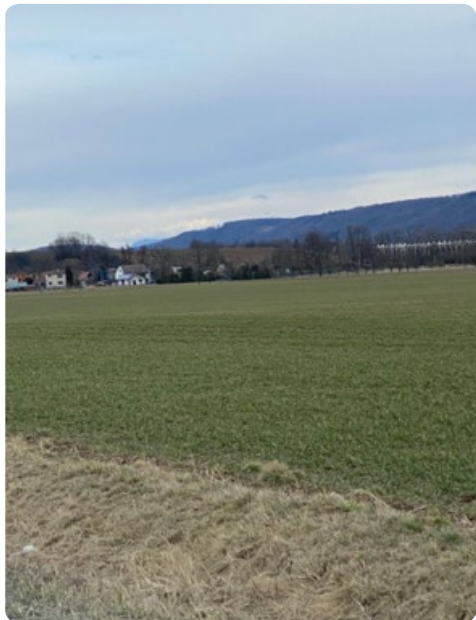
Vrcholek Velkého Javorníku (foto od vjezdu do cihelny)