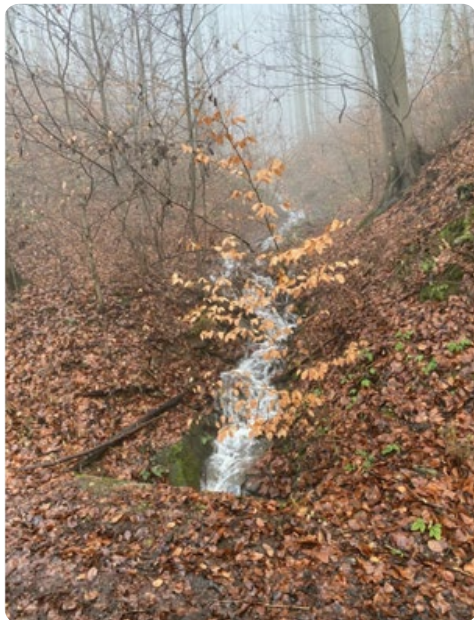
Jarní voda na Gabrielce