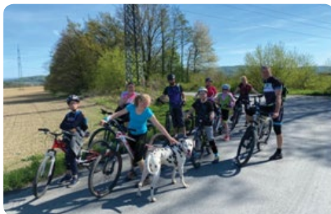
Na konci skalácké cesty pod Hrabůvkou