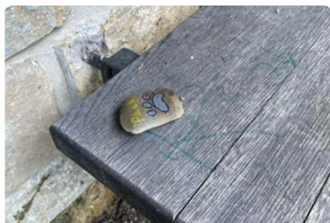
Kamínky – děvčata celou cestu na kolobkách umísťovala kamínky

Jezeráček – zpravodaj Obce Jezernice, květen 2021, č. 2, periodický tisk územního samosprávného celku, čtvrtletník, registrováno u MK ČR pod číslem E 11328. Příspěvky do dalšího čísla pošlete do 31. 8. 2021. Vydává: Obec Jezernice, Jezernice 206, Lipník nad Bečvou 751 31, nákladem 150 ks, vydáno dne 8. 6. 2021. Sazba, zlom a tisk: Computer Media s. r. o.