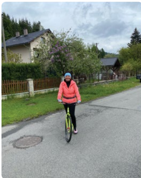
Paní starostka v plné jízdě