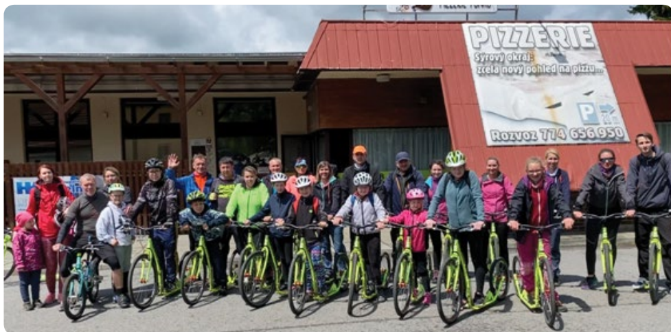
A to jsme všichni „kolobkáři“