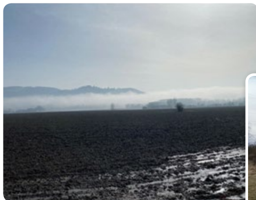
◀ Jezernice v mlze